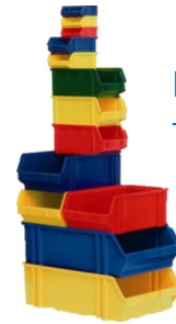
Lager- und Transportkästen