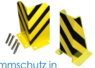
Rammschutz in „L“ und „U“ Form