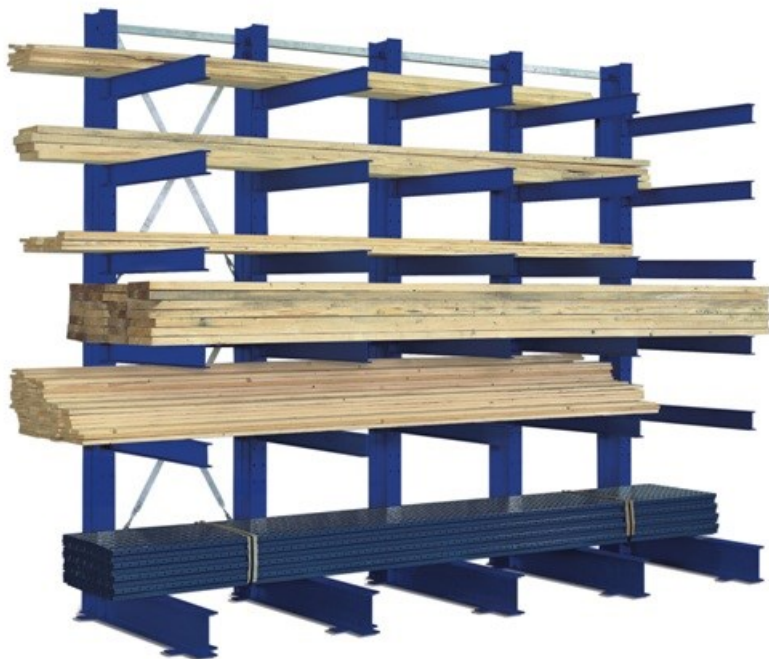
Kragarmregale - Lagersystem für Langgut Für den Innen- & Außenbereich