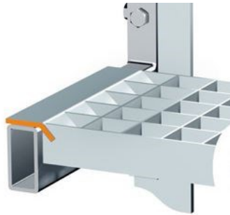
Regalrosten für alle Palettenregalsysteme