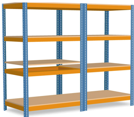
Weitspannregale / Schwerlastregale